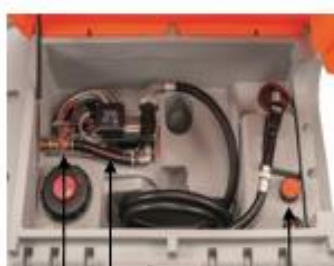
Cematic Duo 24/12 V