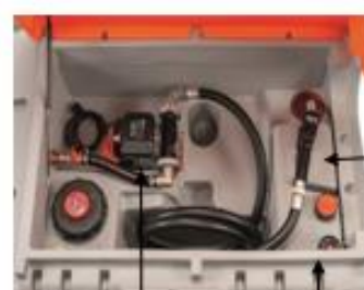
Cematic 72 230 V